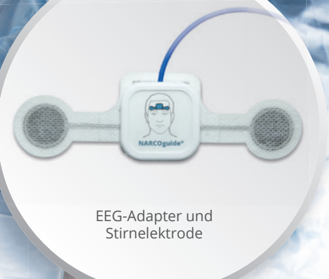
EEG-Adapter und Stirnelektrode